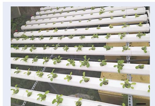
Hình 1: Hệ thống thủy canh hồi lưu cây cải bẹ xanh. Thanh ngang 10 cm.

Hột giống được ngâm trong nước 60 phút rồi gieo vào khay nhựa 28 x 35 x 7 cm có trải miếng mút dày 2,5 cm thấm nước. Sau 7 ngày, các cây con có chiều cao 2 cm với lá thật sẽ được chọn lựa và đặt vào hệ thống thủy canh hồi lưu (kích thước ống nhựa 6 x 6 cm) chứa môi trường MS 13 (chứa khoáng đa lượng và vi lượng). Môi trường dinh dưỡng MS (30 L) được chứa trong các thùng xốp có dung tích 50 L với kích thước 60 x 40 x 30 cm kèm theo một hệ thống bơm nước liên tục (2 cm/s) để dẫn dòng dinh dưỡng vào các ống nhựa. Diện tích một ô thí nghiệm là 1,2 m 2 (gồm 3 hàng, mỗi hàng 13 rọ, mỗi rọ gieo 2 cây). Hệ thống thủy canh được đặt trong nhà lưới với cường độ ánh sáng khoảng 6000 lux, nhiệt độ 28–33°C và độ ẩm không khí khoảng 70% (Hình 1). Trong thời gian thí nghiệm, nồng độ TDS của môi trường được điều chỉnh mỗi ngày về giá trị ban đầu (cây ở giai đoạn từ tuần 2–4 có TDS là 450–500 ppm, cây ở giai đoạn từ tuần 4–5 có TDS là 750–800 ppm, cây ở giai đoạn từ tuần 5–6 có TDS là 950–1000 ppm) bằng cách thêm từ từ dung dịch MS vào thùng chứa sẵn điện cực của máy đo EC/TDS HI9835 (Hanna, Rumani). Theo dõi sự tăng trưởng của cây, ghi nhận diện tích lá (chụp ảnh và sử dụng phần mềm LIA-32 14 ) và trọng lượng tươi của cây sau mỗi tuần.