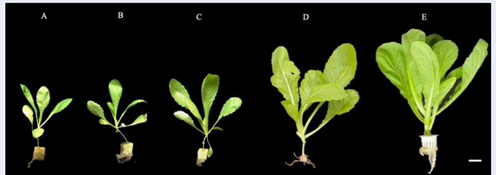
Hình 3: Cây cải bẹ xanh tăng trưởng trong môi trường MS trên hệ thống thủy canh hồi lưu sau 2 (A), 3 (B), 4 (C), 5 (D) và 6 (E) tuần. Thanh ngang 2 cm.

thành phần nguyên tố cao và cân đối 17 . Do đó, môi trường MS thường được sử dụng trong nghiên cứu cơ bản và thực tế ở một số loài cây như cúc, khoai tây, Solanum microdontum , Taraxacum kok-saghz... 17-19 . Do đó, trong nghiên cứu này môi trường MS được sử dụng như môi trường nền cho các thí nghiệm thay đổi nồng độ và tỉ lệ \text{NO}_3^- / \text{NH}_4^+ . Ở thực vật, sự hấp thu và đồng hóa hai dạng nitrogen chính là nitrate ( \text{NO}_3^- ) và ammonium ( \text{NH}_4^+ ) phụ thuộc vào tỉ lệ \text{NO}_3^- / \text{NH}_4^+ trong môi trường, kiểu gene và trạng thái sinh lý của cây trồng 20 . Phần lớn các loài thực vật ưu tiên hấp thu và sử dụng \text{NO}_3^- hơn \text{NH}_4^+ , mặc dù nhu cầu năng lượng cho việc hấp thu và đồng hóa \text{NO}_3^- cao hơn vì trong tế bào \text{NO}_3^- được khử